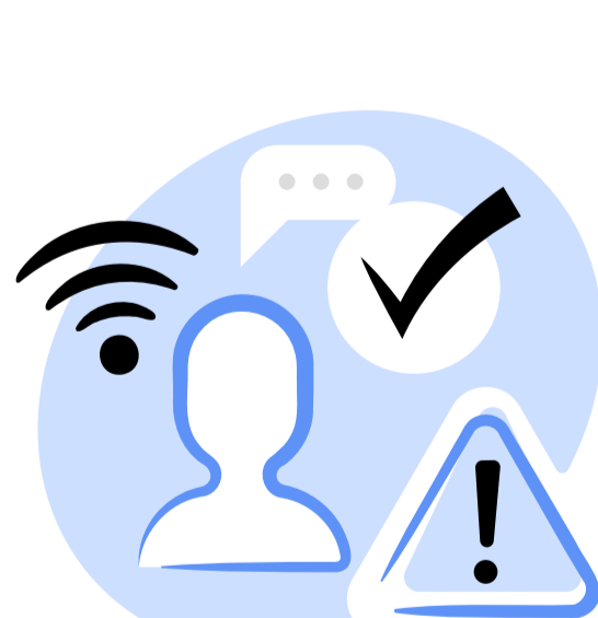
Internet Content - the limits of self-Regulation