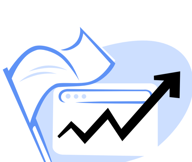
Internet access - quality indicators