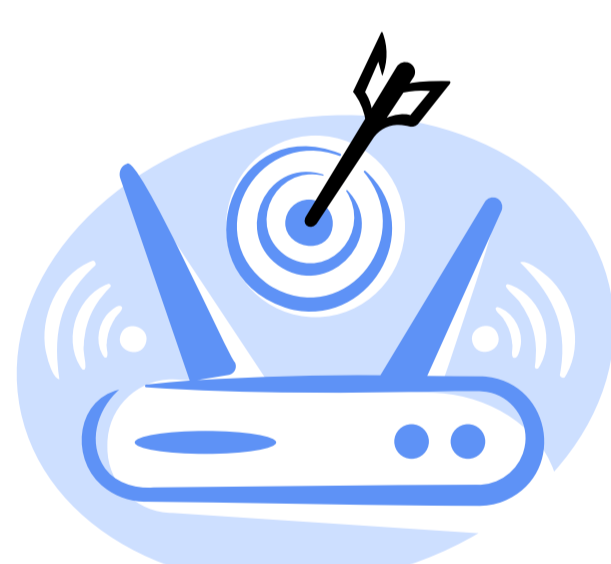
Broadband Georgia - perspectives on Digital Hub