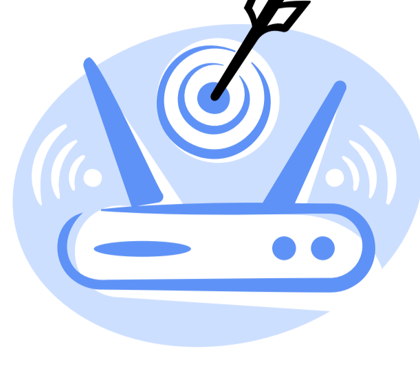
ფართობოლოვანი საქართველო - ციფრული ჰაბის პერსპექტივები