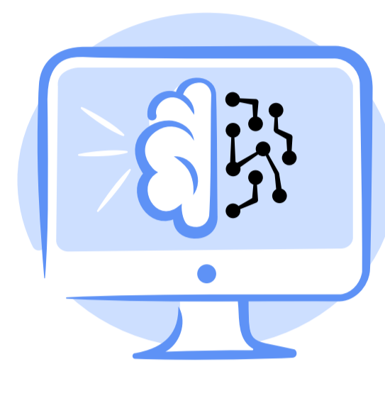
ხელოვნური ინტელექტი - გამოწვევები და შესაძლებლობები