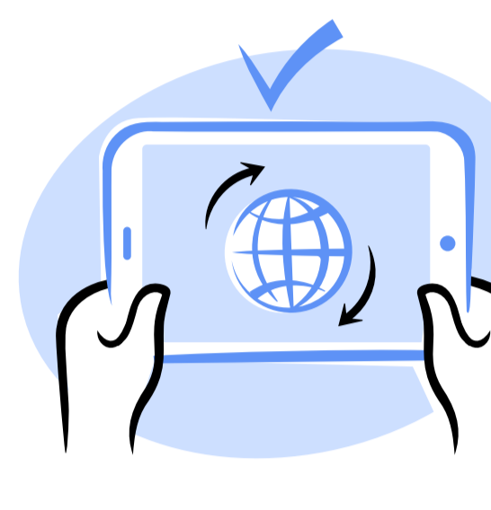
კიბერ უსაფრთხოება - ციფრული უფლებები