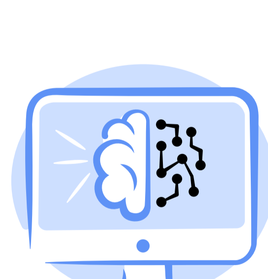
Artificial Intelligence - challenges and opportunities