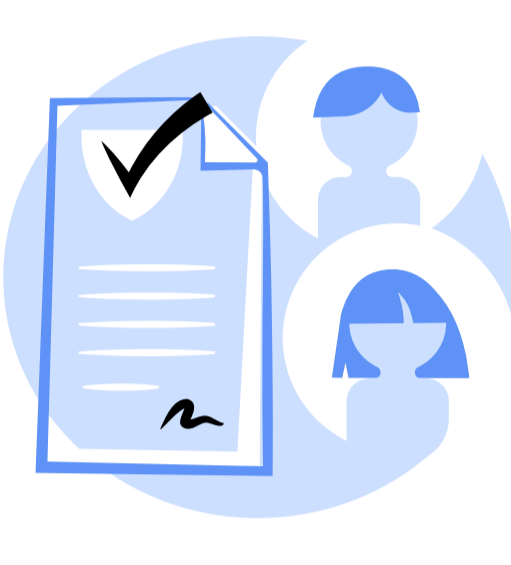
ვირტუალური მობილური ოპერირება - სამართლებრივი და საბაზრო ბარიერები