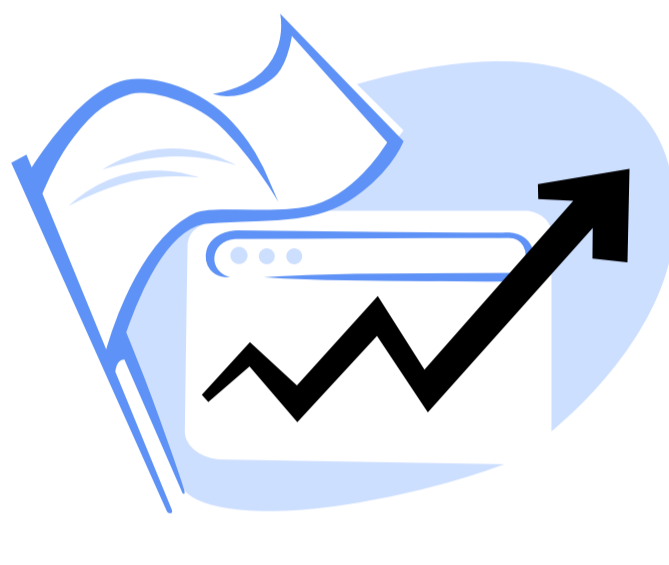
ინტერნეტთან წვდომა - ხარისხობრივი მაჩვენებლები