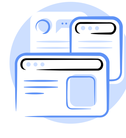
დეზინფორმაცია - გამოწვევები საქართველოს ინტერნეტ სივრცეში