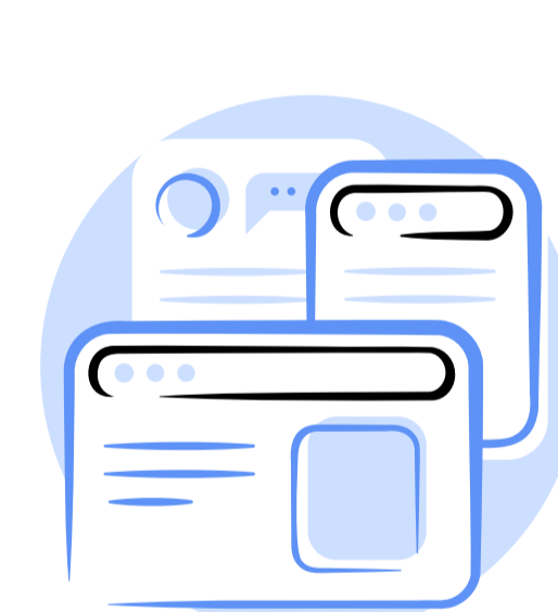
Misinformation - challenges in the Internet space of Georgia