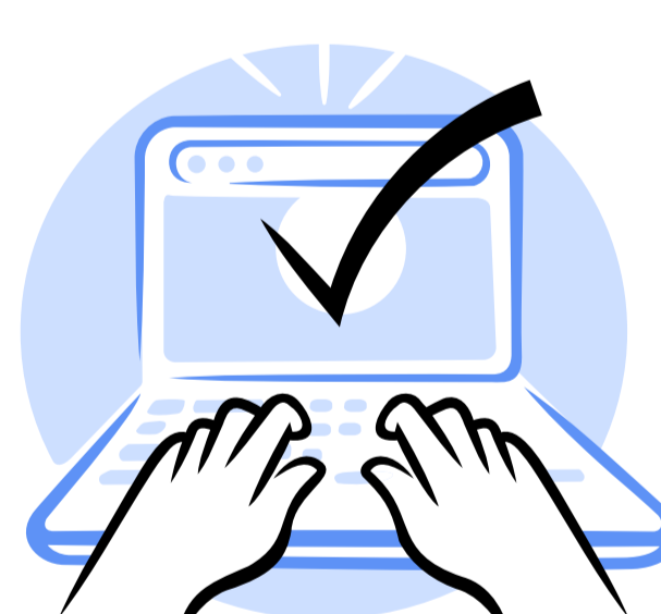
Digital literacy - the role of various sectors