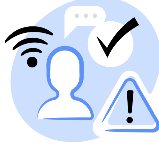
ინტერნეტ კონტენტი - თვითრეგულირების საზღვრები