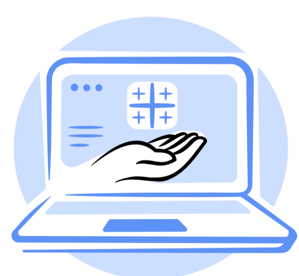
Georgian language in the Internet world