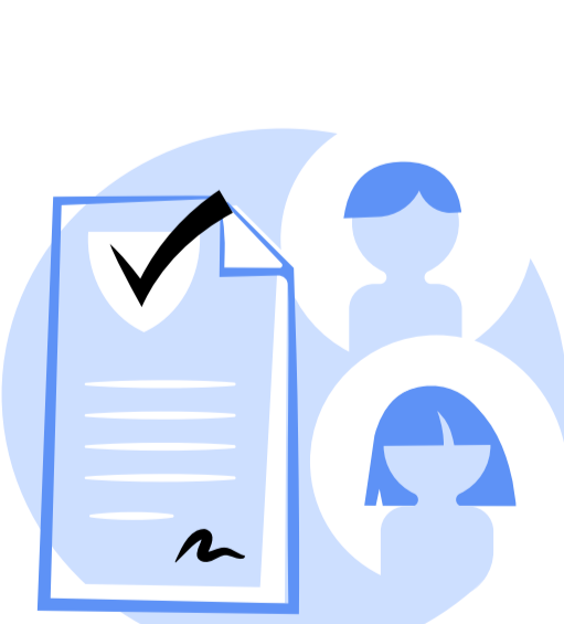
Virtual Mobile Operation - Legal and Market Barriers